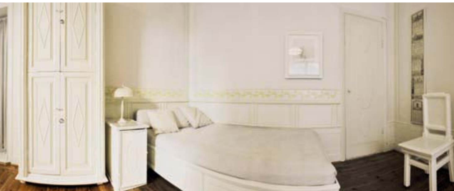
a pardörrarna alltid vara på glänt och pelargonerna stå på planteringsbordet. Besökaren ska uppleva att någon lämnat lägenheten bara för en kort stund.