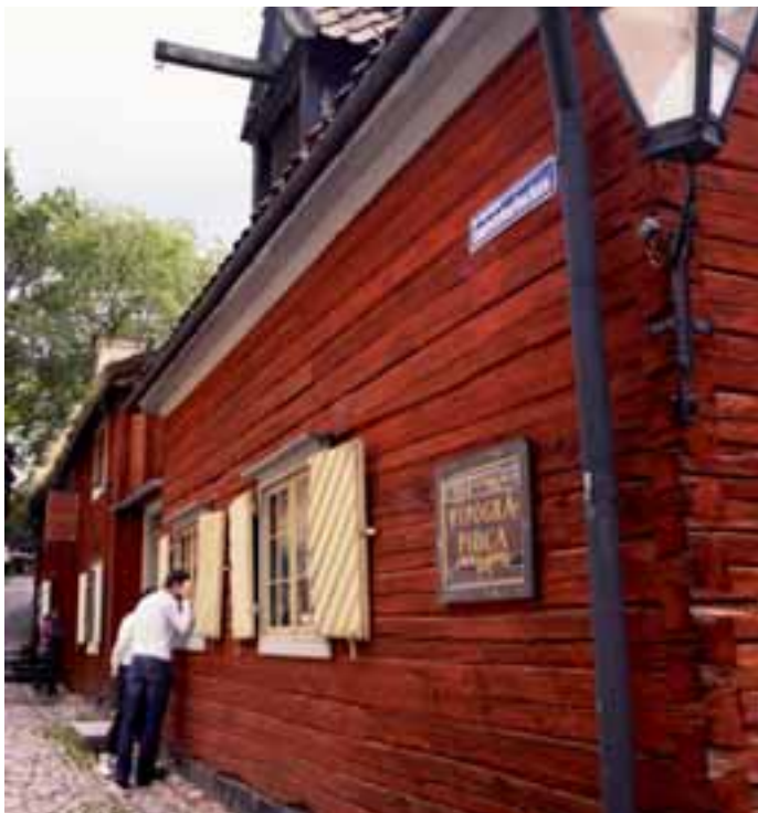
I ett hus från 1725 är ett tryckeri från cirka 1830 bevarat.