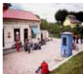
Ett stycke svensk småstad. "Konsumtorget".

● I dag täcker Skansen en yta på 300 000 kvadratmeter. Verksamheten är bland annat djurpark, evenemang, trädgårdar, kulturhistoriska byggnader, firande av högtider och visning av hantverkssysslor.