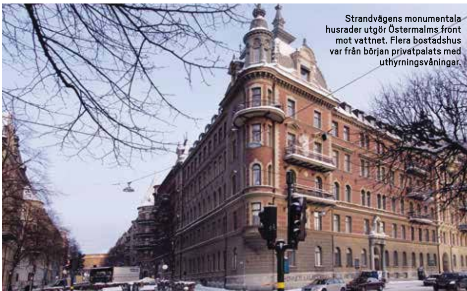
Strandvägens monumentala husrader utgör Östermalms front mot vattnet. Flera bostadshus var från början privatpalats med uthyrningsvåningar.

Kungl. Motorbåtklubben , Djurgårdsbron En av Sveriges mest ärevörddiga båtklubbar från 1915 har sin hamn vid Djurgårdsbron. Klubbens bildande får vi tacka uppfinnaren av bensenmotorn för. Det var först på 1910-talet som de första fritidsmotorbåtarna slog igenom. Innan dess drevs privata småfarkoster med segel eller ångmaskin.