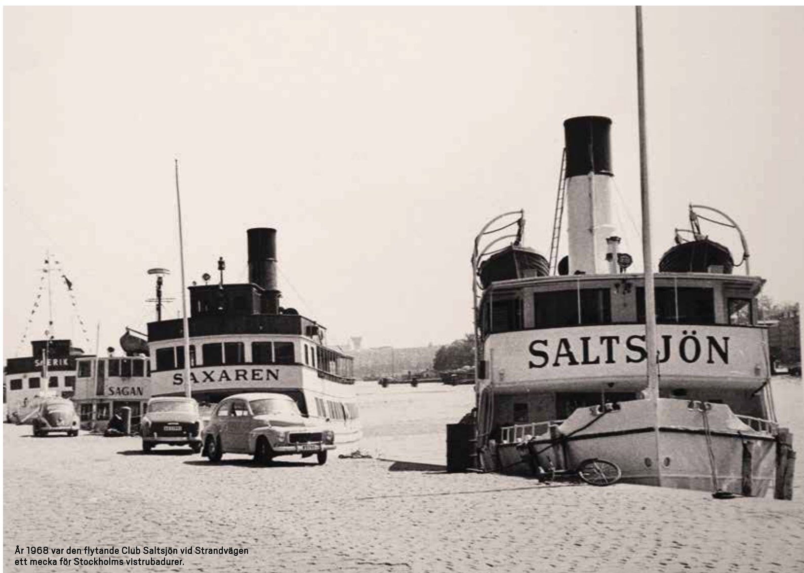
År 1968 var den flytande Club Saltsjön vid Strandvägen ett mecka för Stockholms vistrubadurer.

Huset (1888) och Thaveniuska Huset (1885) berättar att flera av de monumentala byggnaderna som i dag innehåller hyresrätter, borätter eller kontor ursprungligen uppförts som privatpalats, magnifika och representativa residens för landets burgnaste familjer. Dessa sammanhängande små sjuvåningsslott med fasader i barockjugend, nationalromantik, nyrenässans och fransk art nouveau bekostades av förra sekelskiftets industrimagnater, skogsägarpatroner, rika politikerfamiljer, teaterdirektörer, tidningskungar och välbeställd landsbygdsadel. De blev de största – och sista – privata palats som byggdes i innerstaden och var de första bostadshus som förseddes med både elektriska hissar, vattenklosetter och badrum.